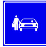
638 (מודיעין והדרכה)

מקום להעלאה ולהורדה של נוסעים (בדרך כלל ליד בית ספר)