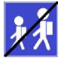
640 (מודיעין והדרכה)