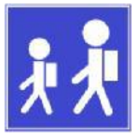
639 (מודיעין והדרכה)

מקום להעלאה ולהורדה של נוסעים (בדרך כלל ליד בית ספר)