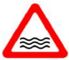
153 (אזהרה והדרכה)