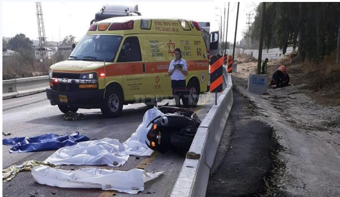
13/11/19 כביש 444 – שני רוכבי דו גלגלי שרכבו בשול נפגעו ממשאית.

מספר רב של תאונות נגרמו בשל רכיבה בשול ועקיפות מימין (בעיקר משאיות ואוטובוסים).