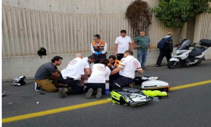
28/10/19 כביש 20 ממחלף יוספטל לקוממיות -רוכב אופנוע שירד במחלף החליק לשול ימין ופגע ברוכב קטנוע שנהרג במקום.