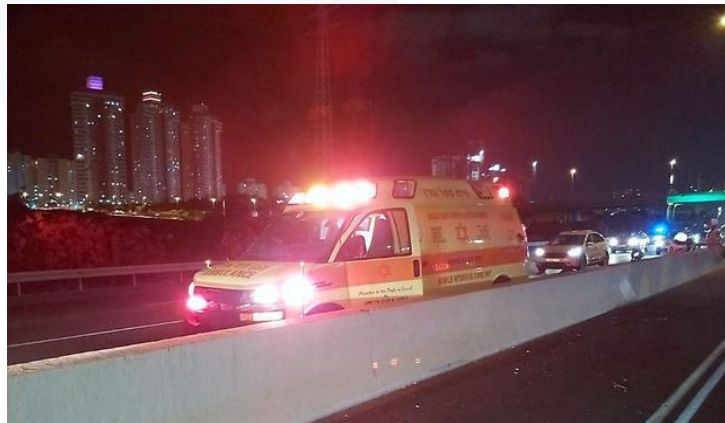
31/10/19 כביש 2 אופנוע איבד שליטה ופגע בעמוד תאורה הנמצא בשטח ההפרדה בין המסלולים.